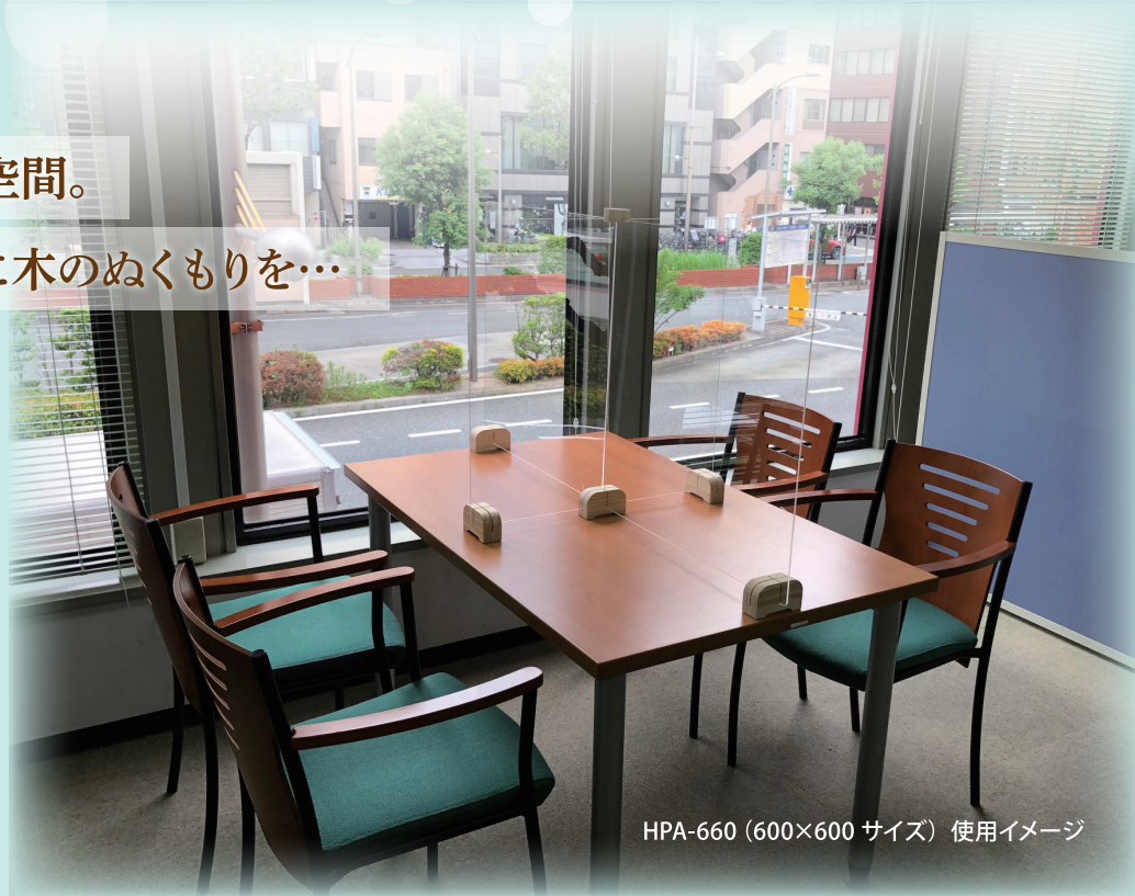
HPA-660 (600×600 サイズ) 使用イメージ

ベースは工具が一切不要で、差し込むだけで簡単に組み立てる事ができます。 一つ一つ木目や色味が違うナチュラルな風合いを持ち味としてお楽しみください。